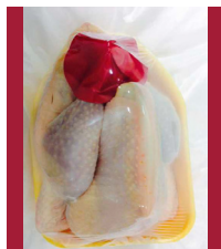
GL201 Gallina eviscerada bandeja